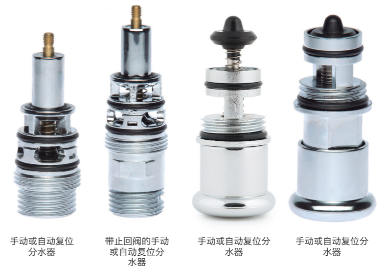
手动或自动复位分水器

手动或自动复位分水器是专为浴缸淋浴设计，允许有两个不同的出水口，保持修长型的设计。